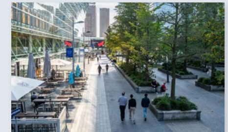
Economie en bestaanszekerheid