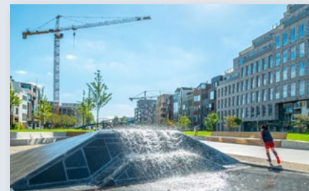
Wonen en woningmarkt