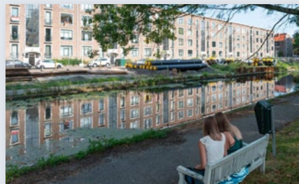
Verduurzaming en energie