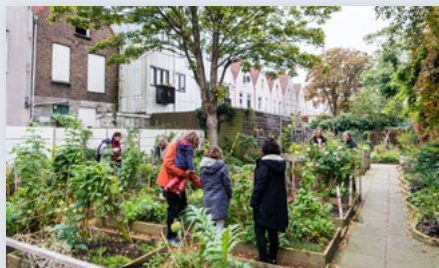
Samenwerken en participatie